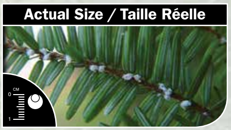
Actual Size / Taille Réelle Cottony sacs at base of needles, 3–6 mm / Ovisacs d'aspect cotonneux à la base des aiguilles, 3–6 mm)

Signs and symptoms of this pest include: • Cottony, white egg sacs at base of needles • As infestations advance, swelling at twig tips, twig dieback, grey foliage, stand level defoliation will occur You can help protect natural areas from this invasive insect: • Check hemlock trees for evidence of HWA • Collect or photograph suspect HWA specimens if found • Report suspect HWA or HWA damage