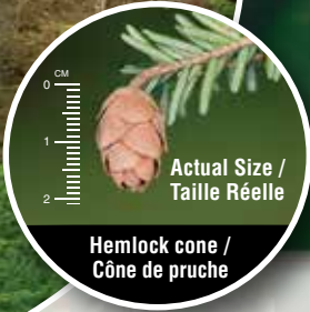
Actual Size / Taille Réelle Hemlock cone / Cône de pruche