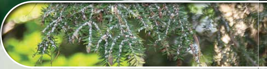
Infested hemlock / Pruche infestée

The hemlock woolly adelgid (HWA, Adelges tsugae ) is a destructive pest of eastern hemlock, an ecologically significant tree species in eastern Canada. Eastern hemlock provides nutrients, soil stability and habitat for animals and plants. HWA feeding removes plant fluids, causing needle drop, twig dieback and tree mortality in as few as 4 years. Early detection of HWA is critical to protecting Canada's forests and environment.