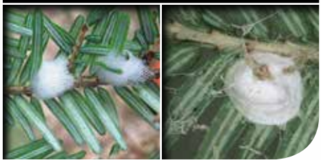
Spittle bug / Cercope Spider egg sac / Sac ovigère d'araignée